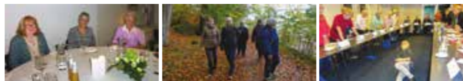
Fotos fra sidste 'Tilbagefaldsseminar' (privat)

Det er ikke nok at overføre penge til vores konto - en tilmelding med samtlige oplysninger skal samtidig tilgå sekretariatet.